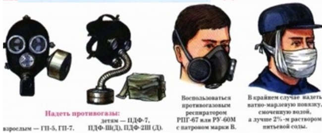
Надеть противогаз: взрослым – ГП-5, ГП-7, ПДФ-Ш(Д), ПДФ-2Ш(Д), детям – ПДФ-7, РПГ-67 или РУ-60М с патроном марки В. В крайнем случае надеть ватно-марлевую повязку, смоченную водой, а лучше 2%-м раствором питьевой соды.