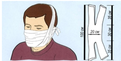
При отсутствии противогаза надеть ватно-марлевую повязку, пропитанную слабым раствором кислоты (при поражении аммиаком) или щёлочи (при поражении хлором)