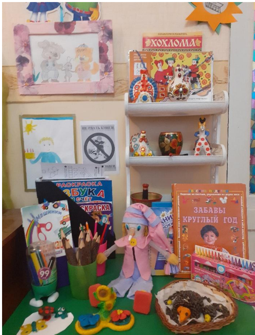
Центр детского творчества