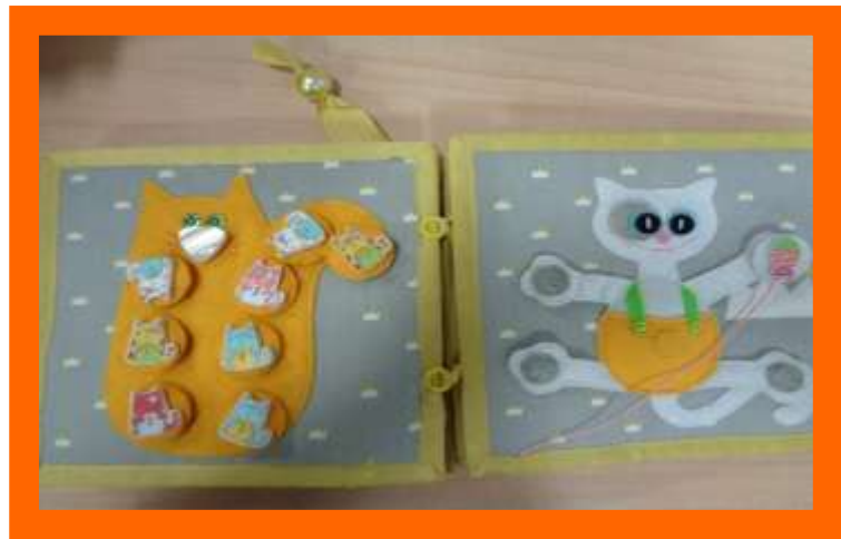
Игра «Поиграем с Мурзиком» (развитие сенсорики и мелкой моторики)