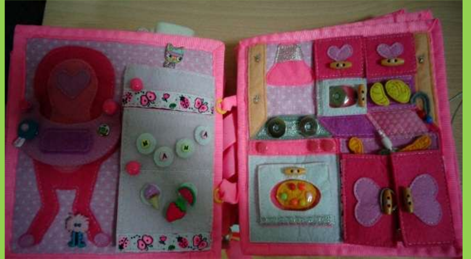
Кукольный домик (из фетра) для сюжетно-ролевой игры