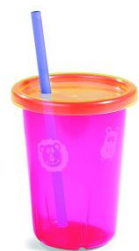
Шторм в стакане

Предложите ребенку подуть на отцветший одуванчик (следите за правильностью выдоха).